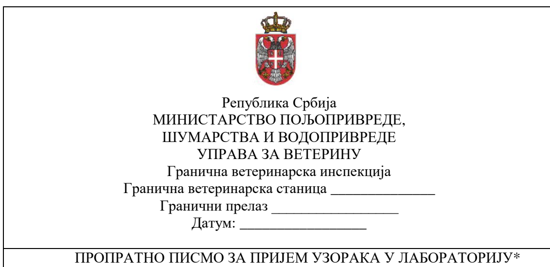
Табела 5 – Пропратно писмо за пријем узорака у лабораторију

Подаци следљивости за узети узорак од стране граничне ветеринарске инспекције, које попуњава гранични ветеринарски инспектор на граничном прелазу: