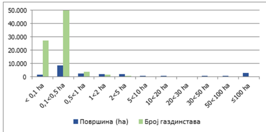
Графикон: Површине под виноградима (ха) и број пописаних газдинстава са виноградима; 2012. година