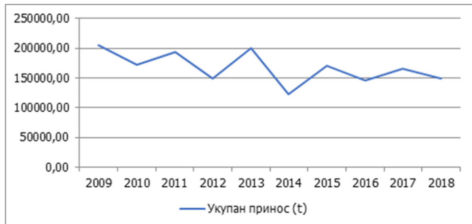
Графикон: Производња грожђа (принос) по годинама (t); 2009-2018. година

Производња грожђа, односно принос је варирао од године до године у зависности од климатских услова, али је у просеку за последњих десет година просечна произведена количина грожђа била 167.363,1t.